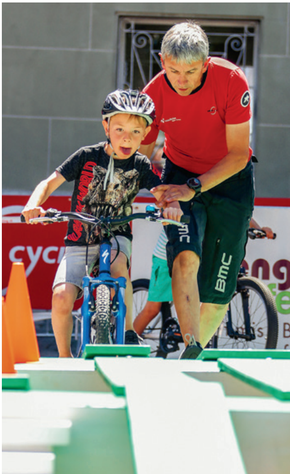
L'acquisition de formes de mouvements figure au centre de la philosophie bikecontrol.